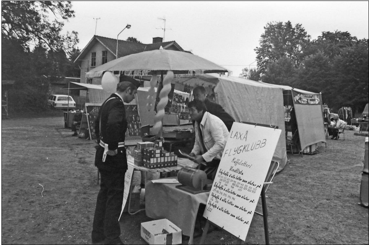
En polisman inspekterar ett stånd på Finnerödjamarken 1974.