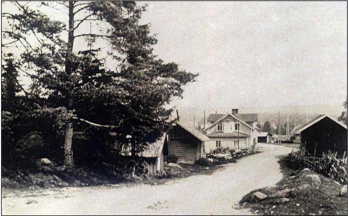
Arresten, sedd från andra hållet, till vänster om vägen.

Under tiden som diskussionen fortsatte om lämplig placering av arresten uppstod ett nytt problem. Stora landsvägen som passerade över Paradistorg skulle få en ny sträckning vilket innebär att den nuvarande arresten skulle hamna precis på väggkanten. På kommunalnämndens sammanträde i juni 1934 beslöt man att göra en hemställan till Vägstyrelsen om att Vägstyrelsen skulle bekosta en flyttning av arresten till en obebyggd tomt tvärs över gamla landsvägen. Arresten blev flyttad men det råder delade meningar om det blev till den föreslagna tomten eller till en annan plats vid torget.