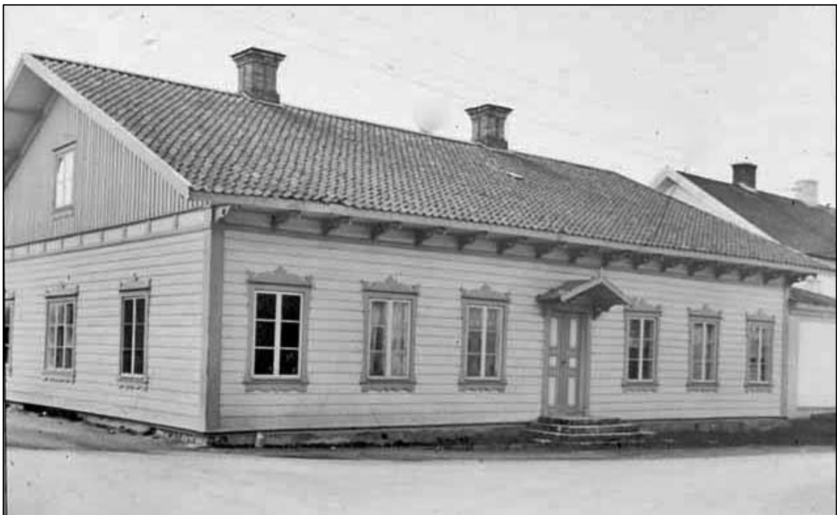
Tingshuset i Hova som var tänkt som arrestlokal.

Kommunalnämnden tyckte att tiden var för knapp och ville överklaga beslutet. På fullmäktigesammanträdet i december 1938 beslöt man att skicka in en överklagan som fick följande lydelse: ”Från Mariestad har meddelats att Finnerödja kommun fått tillåtelse att införa arresterarna till stadens arrest. Denna lösning av frågan godkändes dock icke av länsstyrelsen. Kommunen torde därför vara nödsakad att anordna egen arrest. Men då den av länsstyrelsen fastställda tiden till den 1 juli 1940 är alltför knappt tilltagen, vill nämnden föreslå, att länsstyrelsens beslut överklagas med anhållan om att tidpunkten för arrestens iordningsställande framflyttas till den 1 januari 1941”. Överklagan avslogs. Våren 1939 tog saken återigen en ny vändning. Nu var helt plötsligt Hova kommun villig att bygga en arrestlokal som dessutom skulle bli klar inom lagstadgad tid 1 juli 1940. Hova kommun skulle ansvara för arresten i 30 år och Finnerödja kommun skulle stå för transportkostnaderna till Hova men även för matkostnaderna för de intagna under tiden de satt i arresten. (Något kommunalhus blev inte byggt i Finnerödja förrän 1963 men det är en annan segdragen historia).