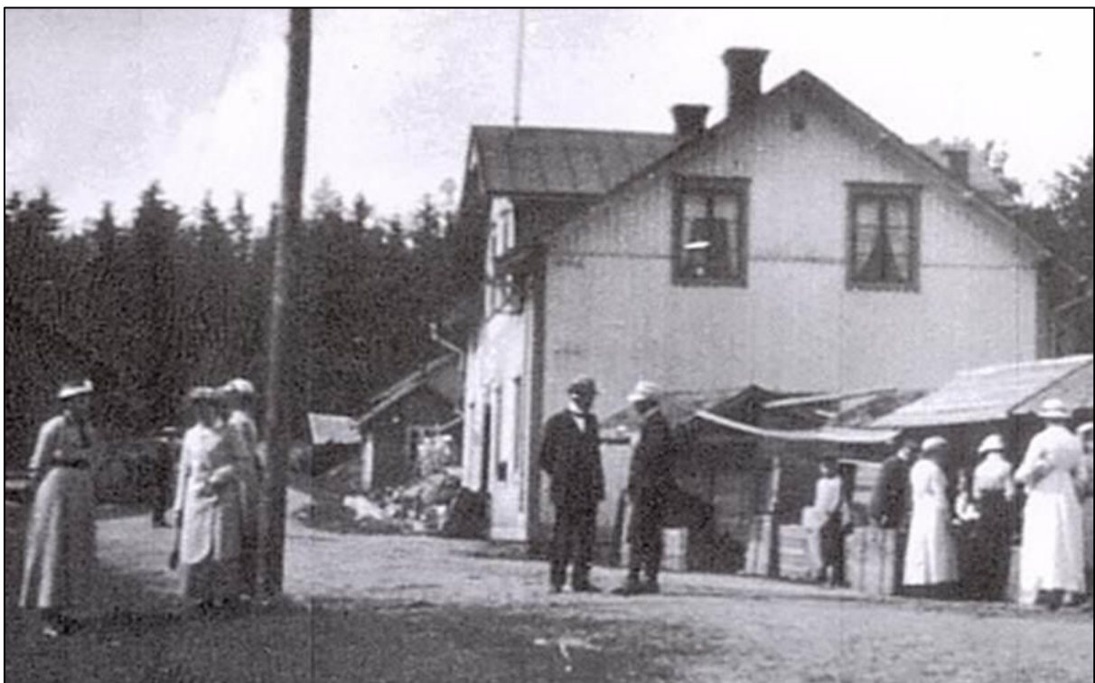
Arresten låg i det lilla huset som syns precis bortanför det stora huset (som senare blev Finnerödja).

vaktrum. Föreståndaren för Finnerödja gästgiveri var villig att bidra med 50 kr till bygget, resten av kostnaden skulle kommunen stå för. Det gick ofta livligt till vid marknadsdagarna med många slagsmål som följd och Finnerödja behövde en arrest där bråkmakarna fick sitta och nyktra till. Vid kommunalstämmans sammanträde i december samma år hade det kommit in ett antal anmälningar gällande lag och ordning. En gällde ölförsäljningen vid Gästgiveriet. I stämmans protokoll står det att ”befogade anmärkningar förfinnes mot det sätt, hvarpå ölförsäljningen vid Finnerödja gästgivargård nu bedrifves, och att denna försäljning visat sig utöfva ett i hög grad skadligt inflytande, tydligast bevisat däraf, att ordningen af betänklig, t.o.m. lifsfarlig art vid gästgivargården förekommit”. Kommunalstämman tillsatte en kommitté som fick i uppdrag att vidta lämpliga åtgärder för att få slut på ölförsäljningen vid gästgiveriet. En annan anmärkning gällde de personer som av kommunen valts att biträda fjärdingsmannen när det gällde ordningen vid torgdagarna. Det hade framkommit att dessa personer brustit i sitt uppdrag. Antingen hade de inte inställt sig för tjänst när fjärdingsmannen kallade eller också hade de varit ”försumliga och liknöjda”. Stämman beslöt att dessa personer skulle få böta 5 kr varje gång de misskötte sitt uppdrag.