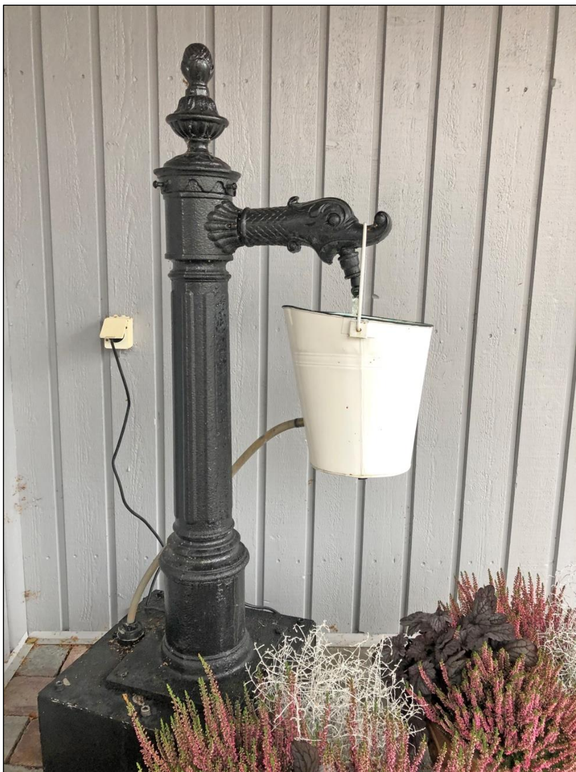
Den gamla pumpen på sin nya plats vid reningsverket i Laxå.

Den nedre pumpen, som är borttagen, står numera på entrétrappen vid Laxå reningsverk. Där fungerar den nu som ett slags "fontän". Vattnet pumpas runt, runt året om.