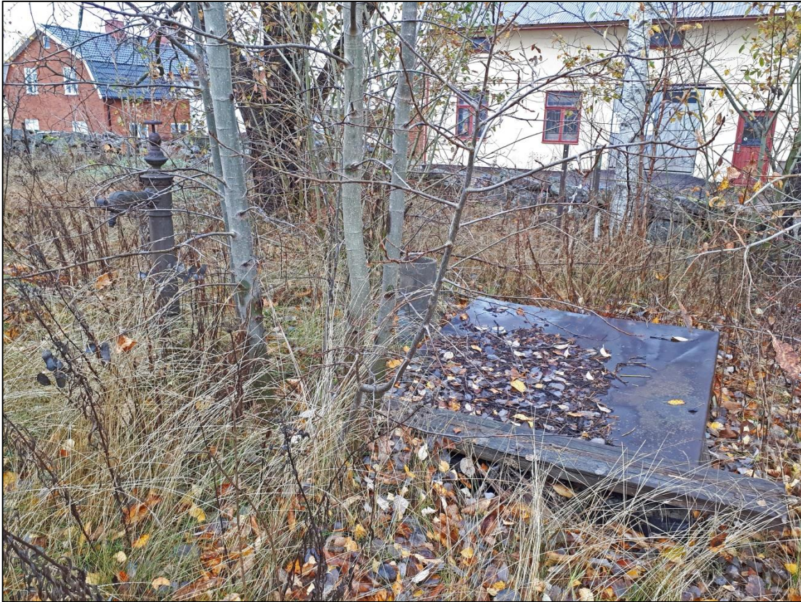
Under locket finns det lilla "rummet" med cementväggar. Pumpen syns till vänster och i bakgrunden Fredbergs gamla snickerifabrik.