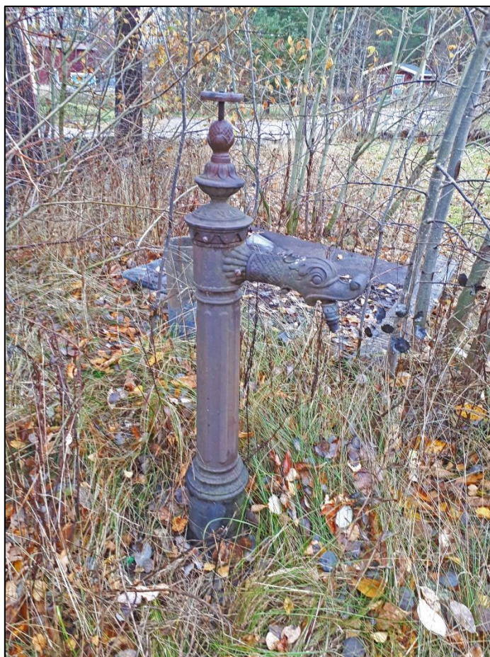
Den övre pumpen finns fortfarande kvar.