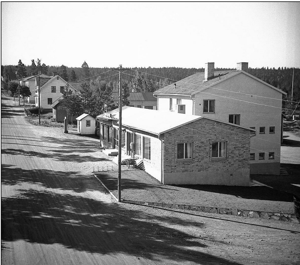
Den lilla frisersalongen skymtar bortanför Gulfmacken.