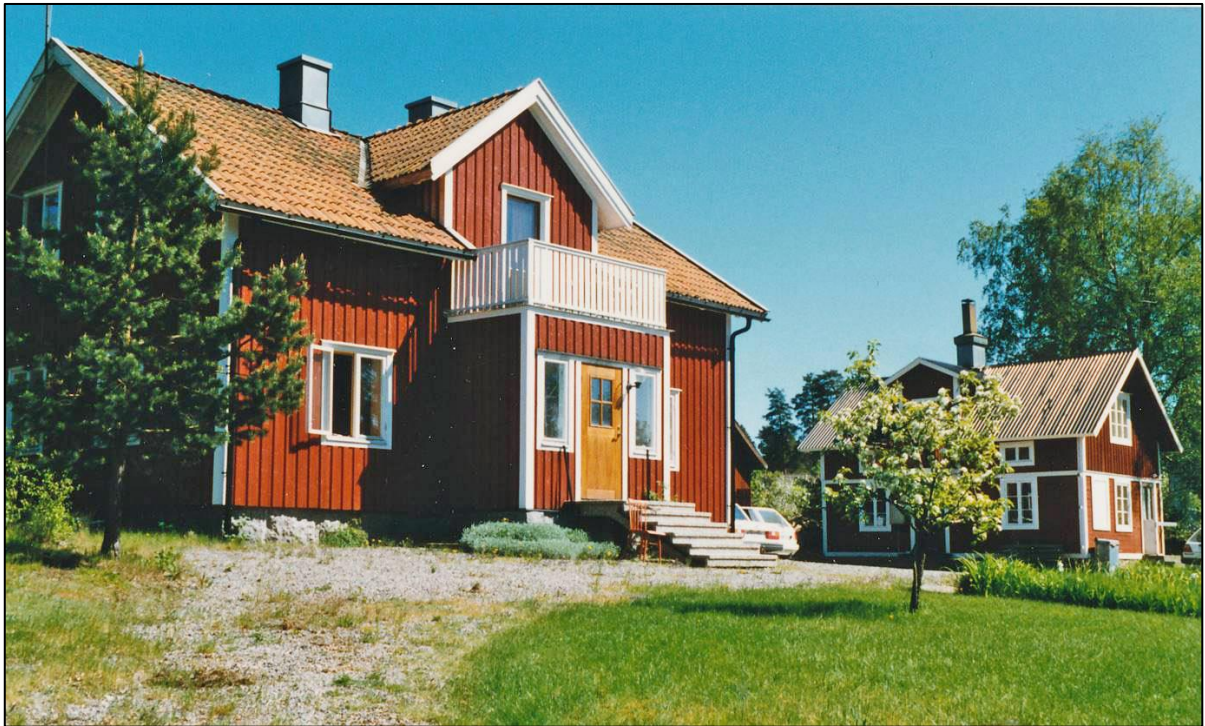
Huset är numera åter rött, precis som det var från början.