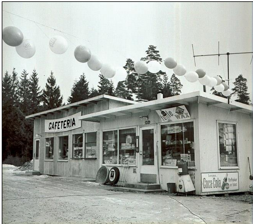
Invigning av Färdshuset Jordgubben 1964. Okänd fotograf.