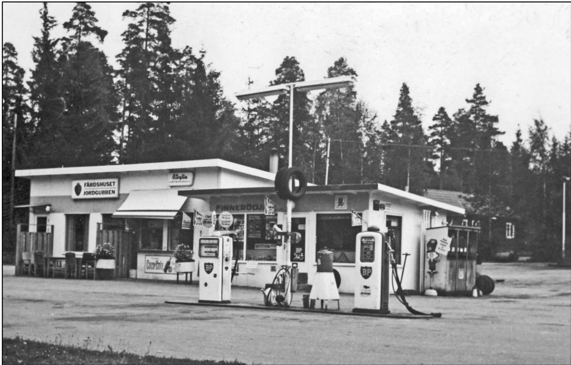
Skylten "Färdshuset Jordgubben" har kommit upp.