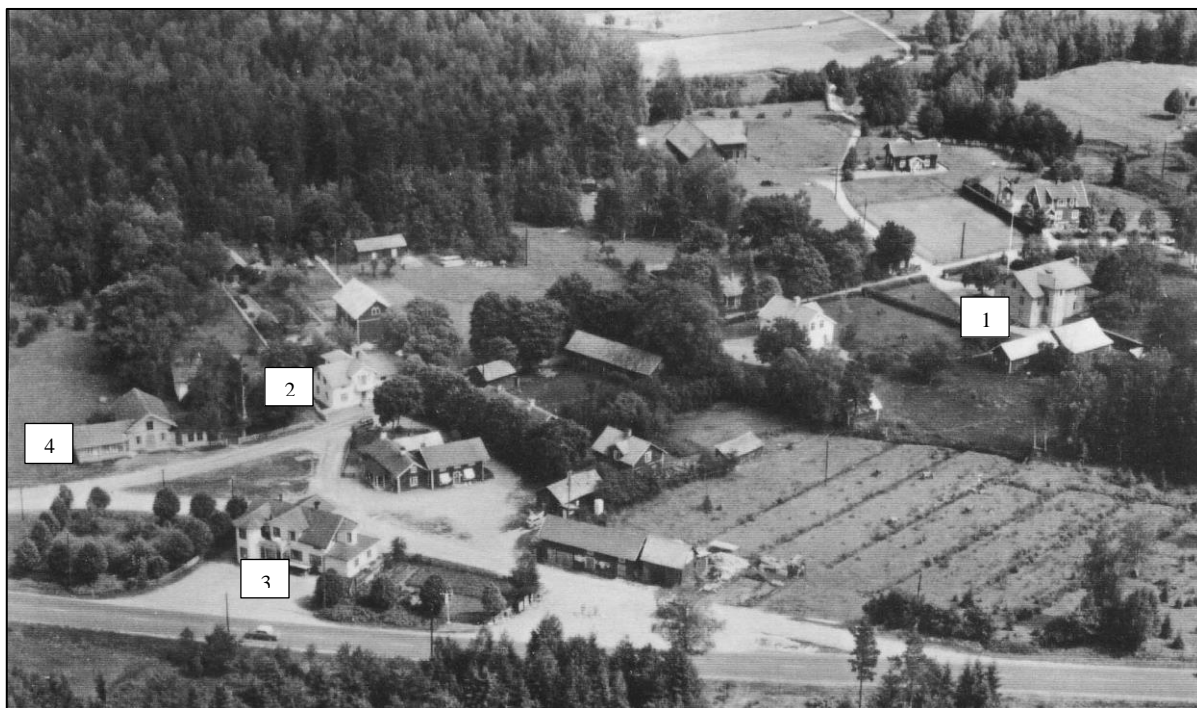
Eisers olika lokaler vid Paradistorg. 1. Syfabriken 2. Carlboms hus 3. Stenvists hus (Finngården) 4. Missionshuset. Vykort.