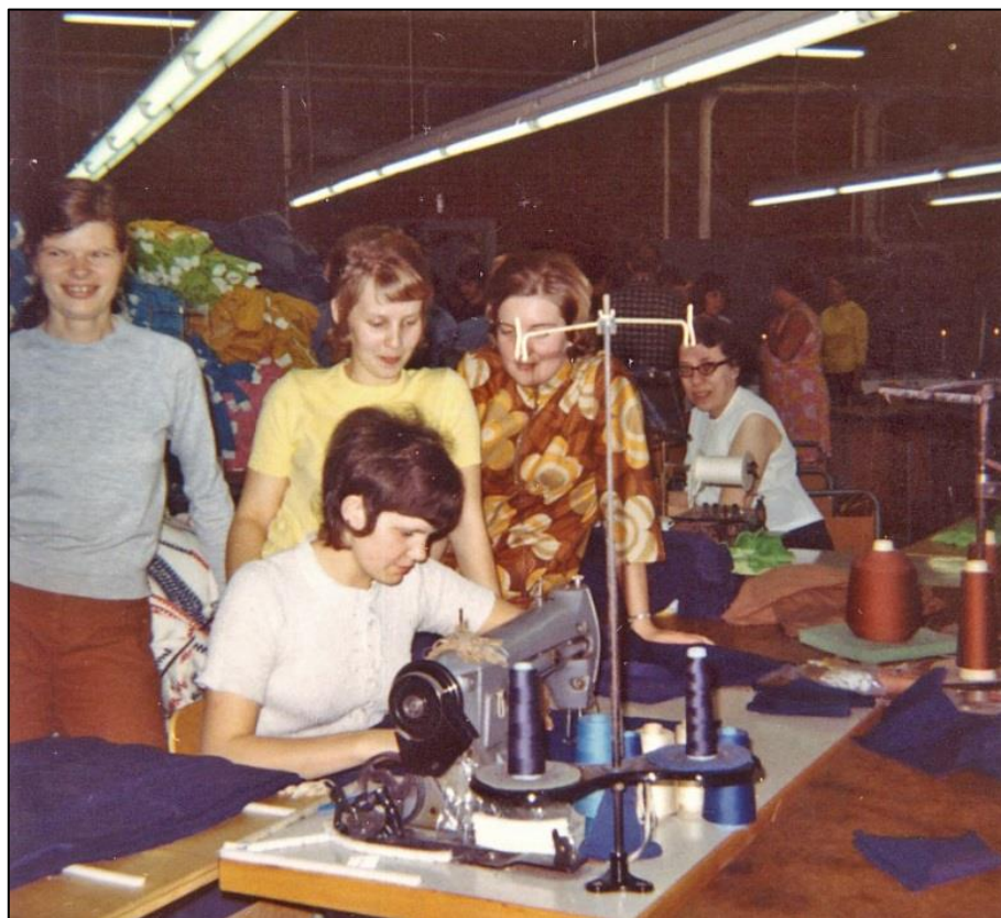
Symaskinerna var betydligt modernare än i gamla syfabriken.