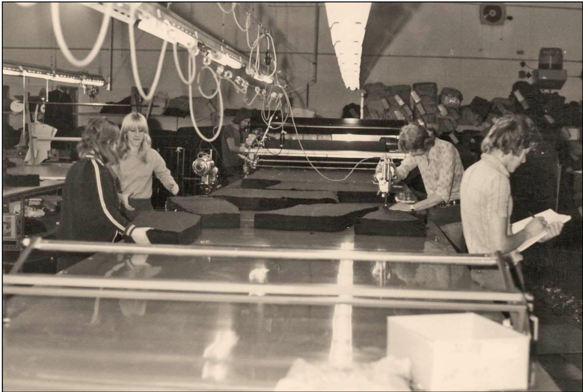
Skärsalen på Eiser.