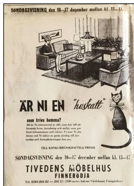
Annons för Tivedens Möbelhus.