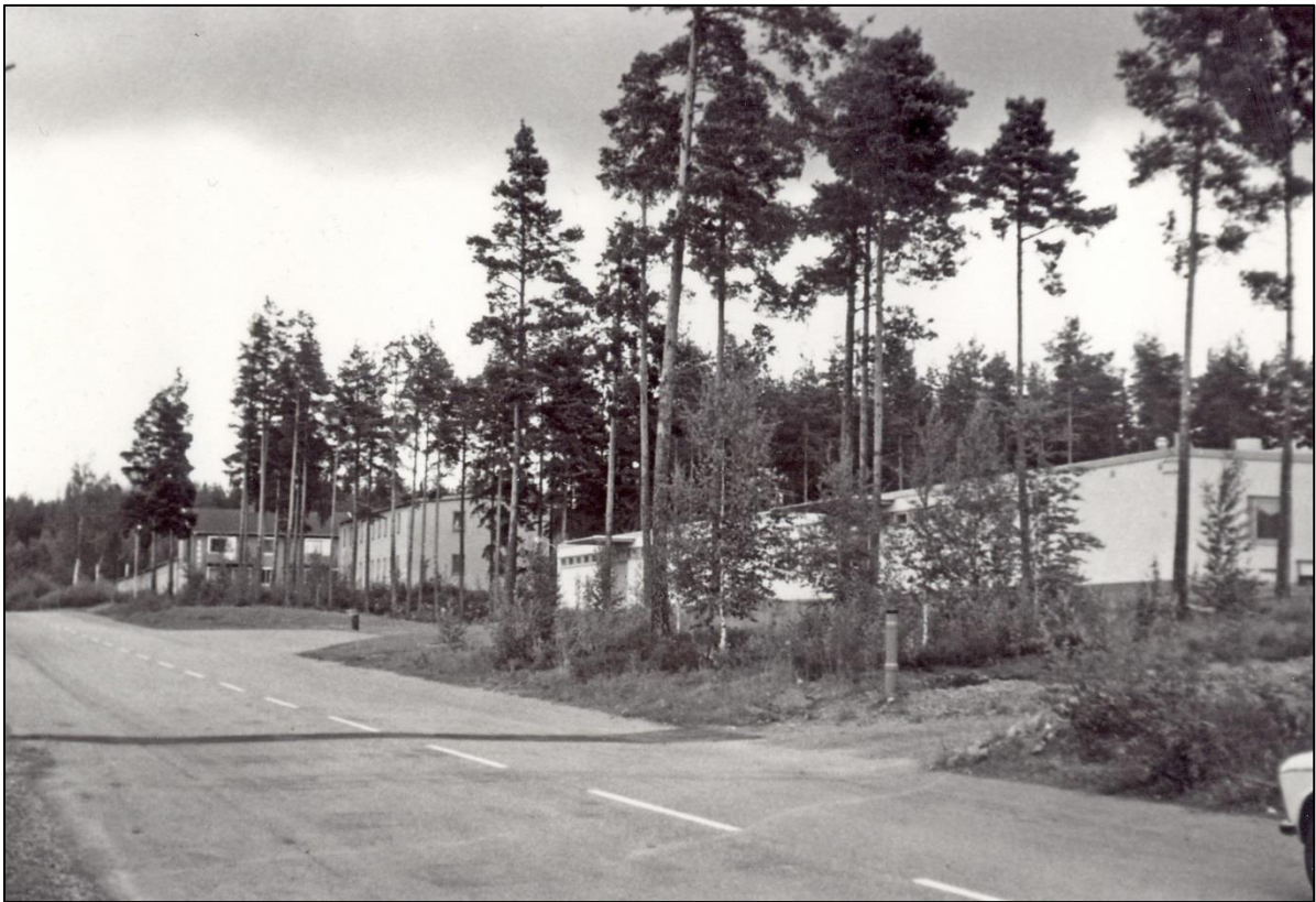
Nya Eiserfabriken i förgrunden. Snett ovanför ligger Finbo.