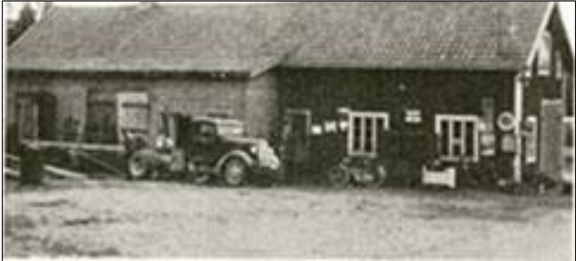
Bilverkstan omkring 1940