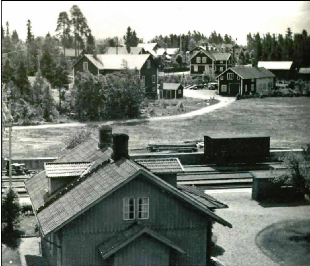
Baksidan av bilverkstan syns långt upp till höger.