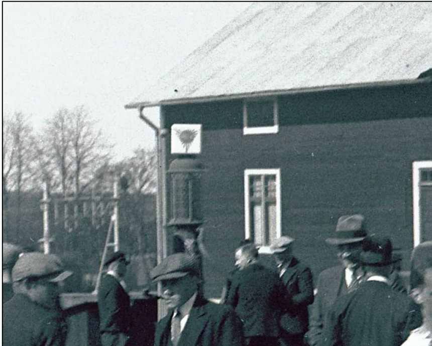
Här syns överdelen på den första bensinpumpen.

Själva bensinpumpen har bytts ut och moderniserats ett antal gånger. På några av fotona kan man se hur utseendet har förändrats under årens lopp. Gulfmacken i Finnerödja upphörde 1970.