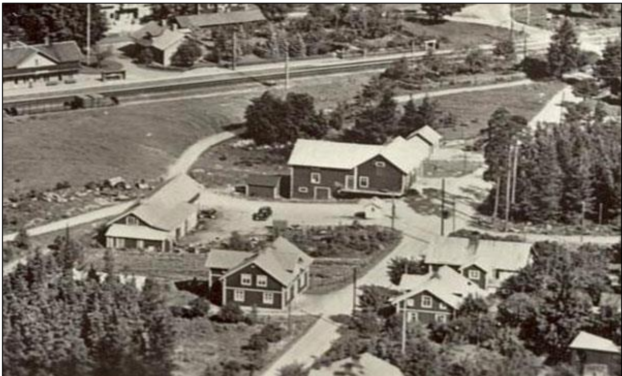
Bilverkstaden, till vänster i bild, som den såg ut på 1940-talet.

Fredbergs snickerifabrik var en av kunderna som beställde arbeten av smeden men det är oklart vilken typ av smidesarbete det gällde. 1945 sökte Finnerödja bil- och cykelverkstad tillstånd hos kommunen för att få sälja begagnade metallvaror. Ansökan bifölls.