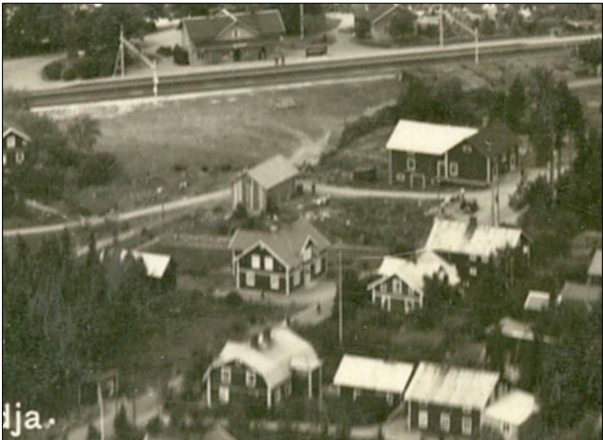
Bilverkstan syns mitt i bilden. Snett upp till höger ligger gamla Konsum. Flygfoto från början av 1930-talet.