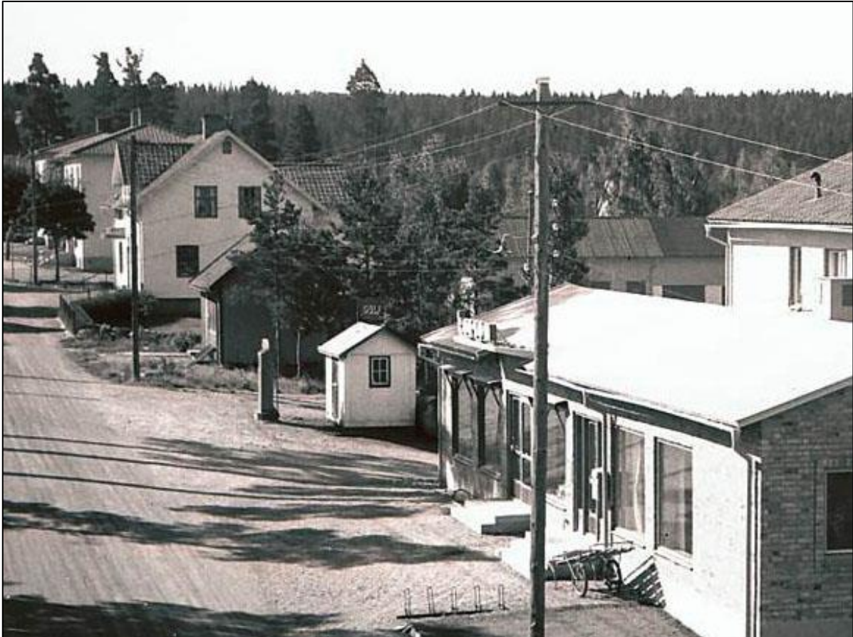
Bensinpump från 1950-talet.