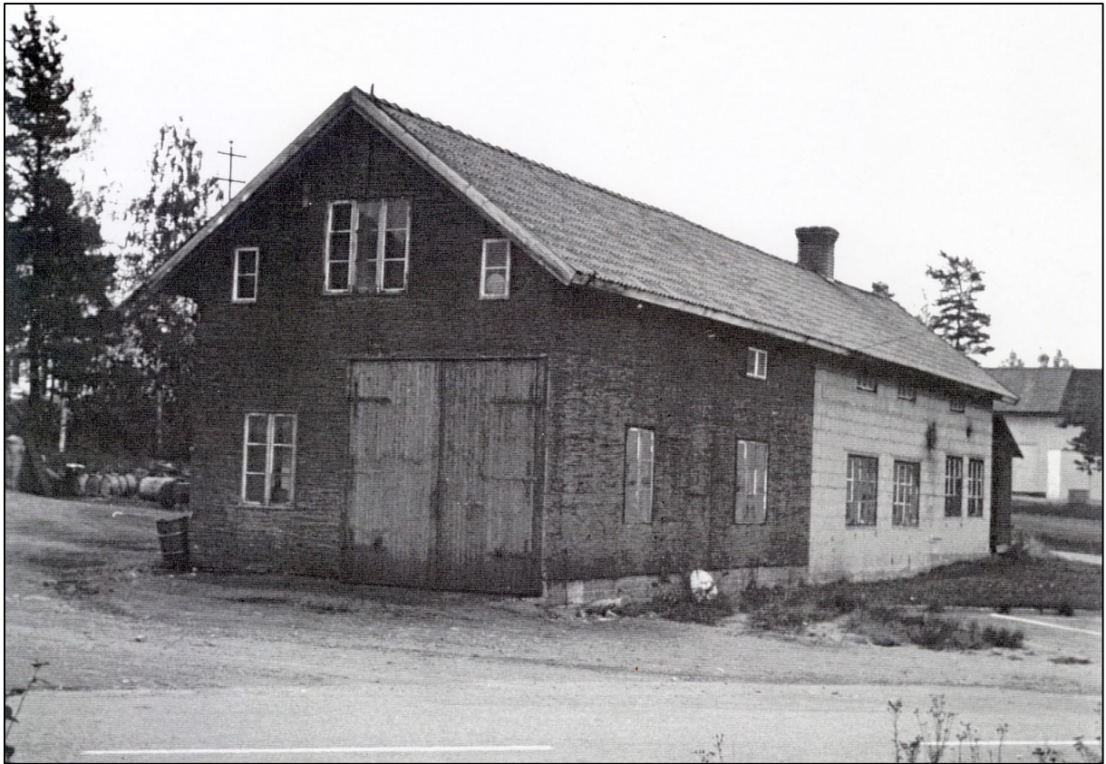
Bilverkstan lades ner 1981.