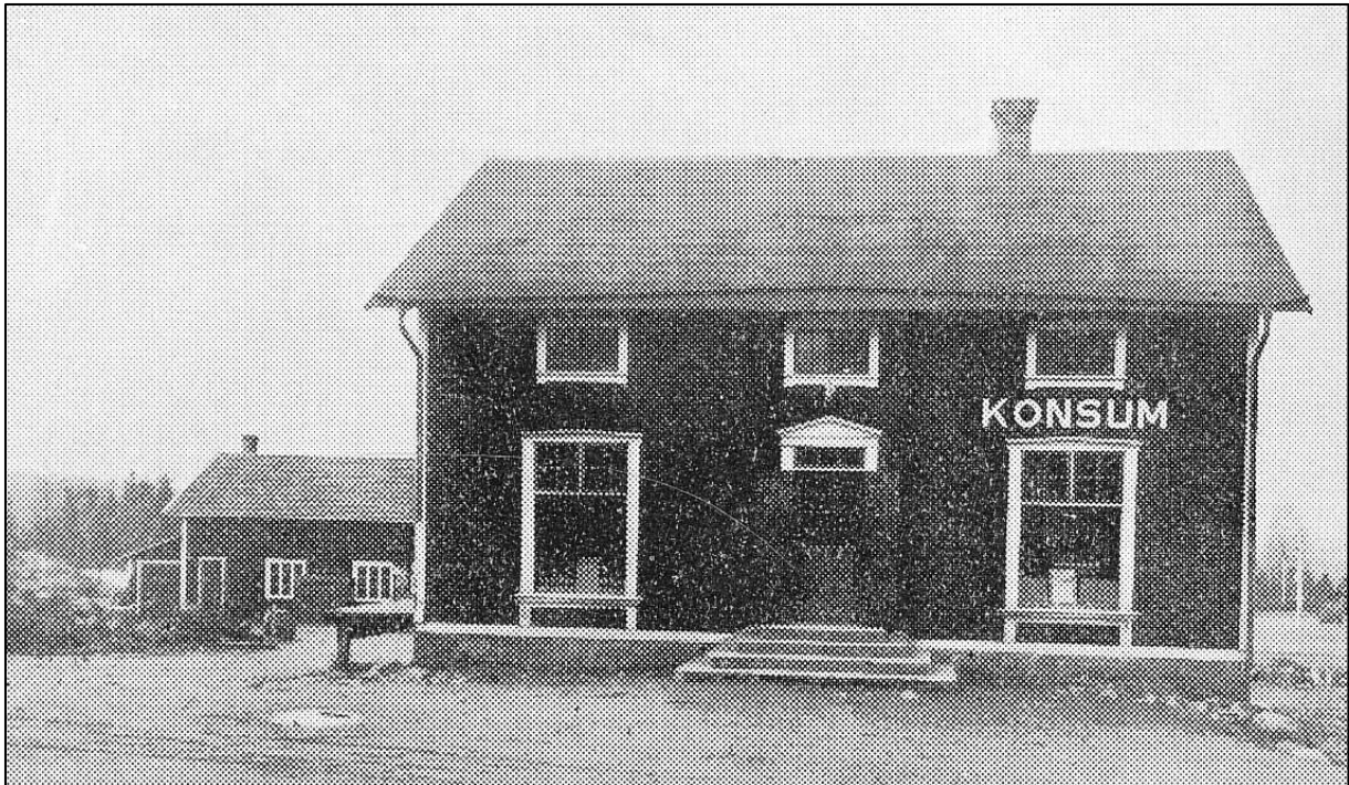
Bilverkstan syns till vänster om Konsum. Foto från 1936.