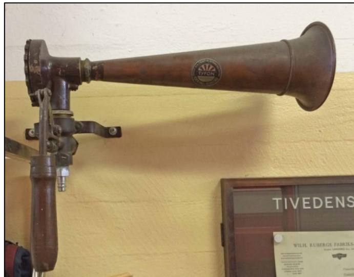
Den första tyfongen som satt på bilverkstans tak.

När Finnerödja fick en egen brandkår i början på 1940-talet blev bilverkstan involverad i verksamheten. Tyfongen som ljöd över samhället när larmet gick satt nämligen på bilverkstans tak. Det finns en säker uppgift på att tyfongen fanns på plats 1941. Verkstan hade inget med själva utlarmandet att göra, det sköttes från annan plats. 1953 byttes den gamla tyfongen ut mot en ny. På gaveln till bilverkstan, intill den stora porten, satt ett brandskåp som allmänheten själva kunde använda för att larma vid brand. När Finnerödja fick sin första egna brandbil 1947 byggdes ett provisoriskt garage bakom bilverkstan. Provisoriet blev kvar till 1963 då Finnerödja äntligen fick en brandstation i det nybyggda kommunalhuset strax bortanför bilverkstan. Tyfongen och brandskåpet flyttades till den nya brandstationen. Den första tyfongen sattes upp, som minne, på en vägg inne i brandstationen.