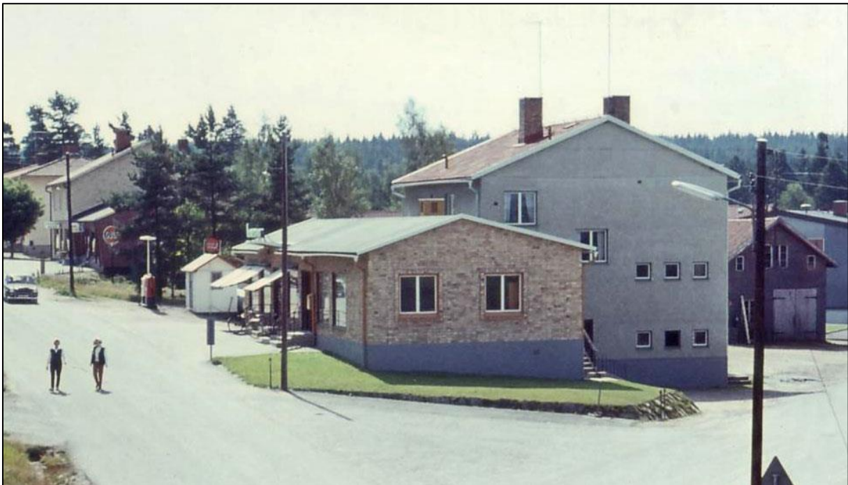
1964 fanns det en modern bensinpump och belysning vid macken.