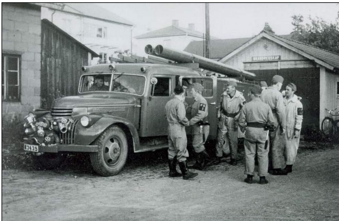
Det gamla brandbilsgaraget bakom bilverkstan. Verkstan syns till vänster.