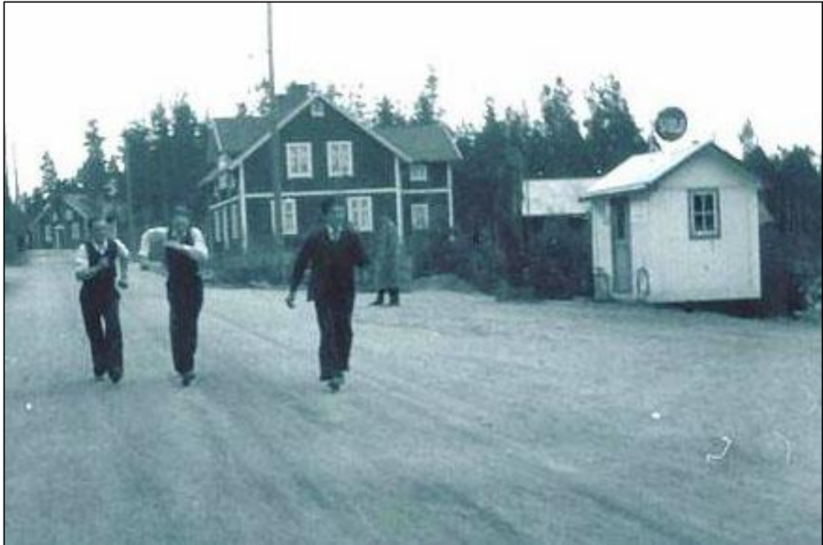
Den lilla vita "bensinkiosken" har kommit på plats. Gulfmärket sitter på taket.