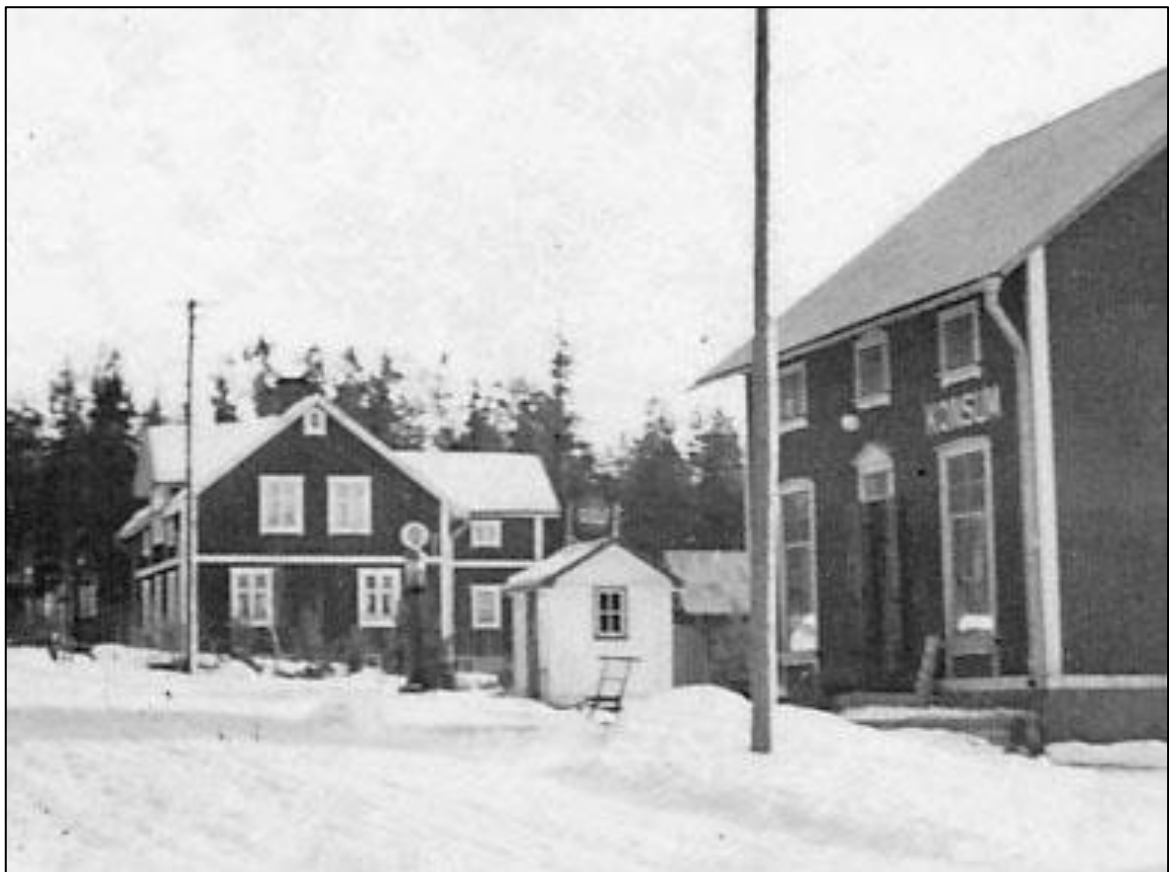
En modernare bensinpump står utanför "bensinkiosken". Kort från 1940-talet.