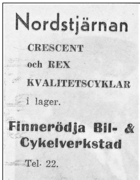
Annons från 1949