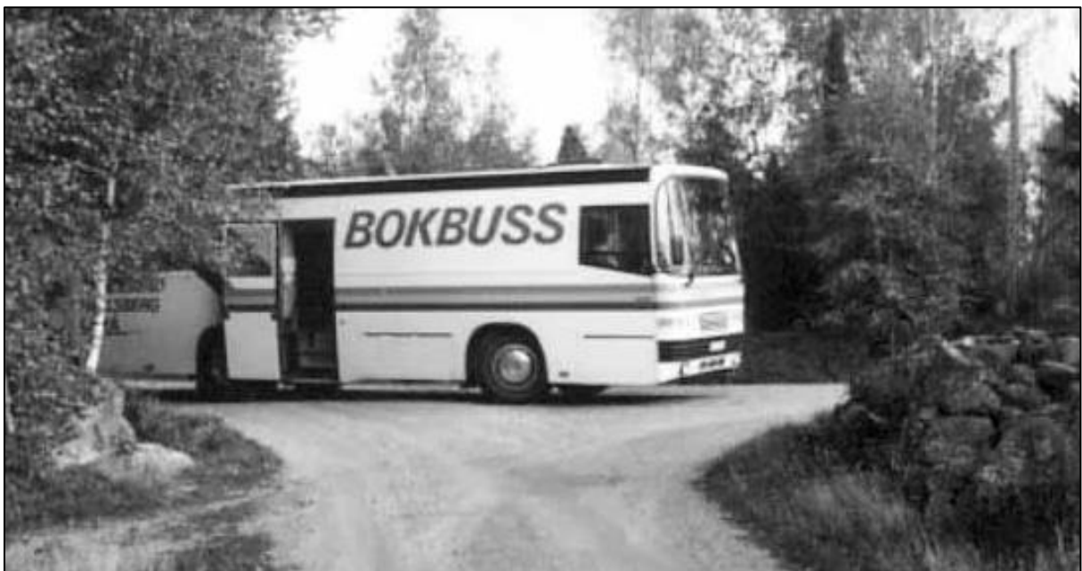
Den nya bokbussen.

Efter några år började det uppstå fel på bussen och de blev med tiden fler och fler. I december 1986 började man diskutera ett inköp av en ny buss. Året därpå fick firma Torsten Lund i Laxå i uppdrag att leverera den nya bokbussen till en kostnad på nära en miljon kronor. De tre kommunerna delade lika på den summan. Den nya bussen var större, hade starkare motor, bättre personalutrymme, kylskåp och toalett. Den levererades till Laxå bibliotek i juli 1987. Den nya bokbussen hade plats för 3 000 böcker vilket var ca 1000 fler än vad den gamla bussen kunde ta. Premiärturen skedde i augusti. Det blev ett uppsving för boklånen när den nya bussen togs i bruk. För Laxås del kom man upp i 16 000 utlånade böcker per år.