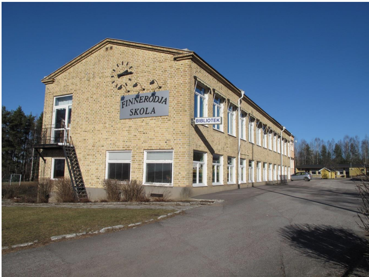
Biblioteket flyttade tillbaka till skolan vid årsskiftet 1969/70. Foto Gunn Sjöstedt.