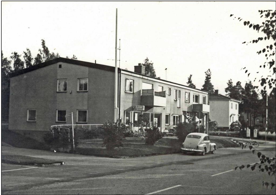
Biblioteket flyttade till kommunalhuset på Mobäcksvägen 1967.