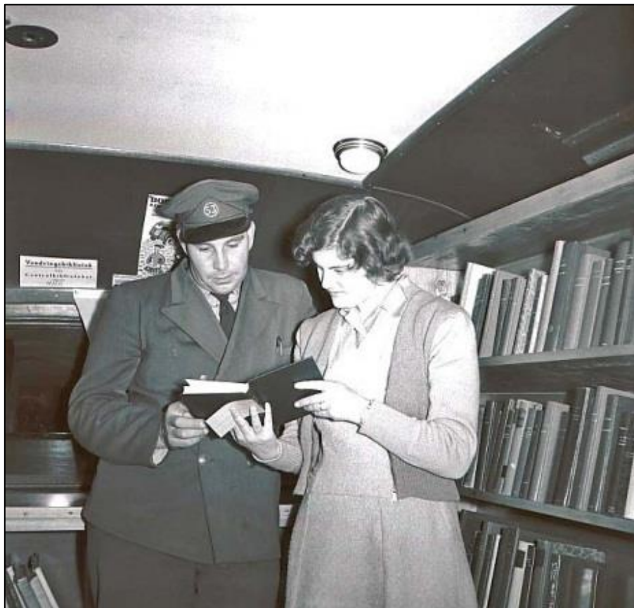
Interiör från en gammal bokbuss, förmodligen från 1950-talet.