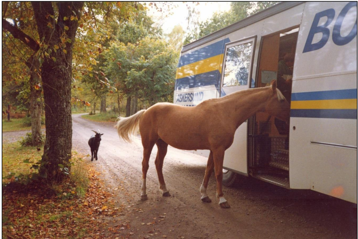
Ett par udda låntagare på väg till bokbussen.