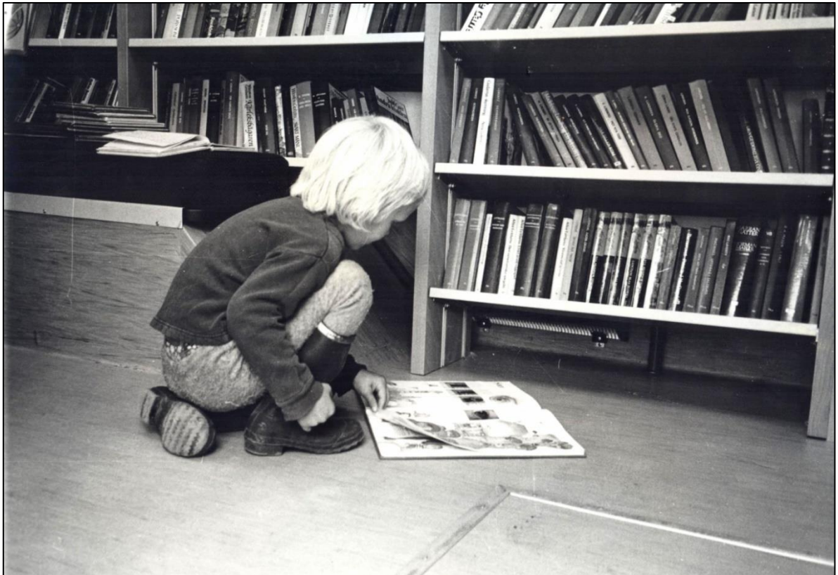
En ung låntagare har hittat en intressant bok.