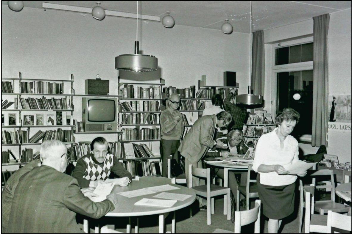
Full aktivitet i biblioteket 1977.